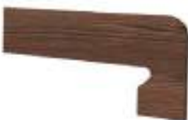
ZANQUÍN FIORENTINO DCHA/IZDA 39,5 x 17,5 cm - 15.8"x 7.0"