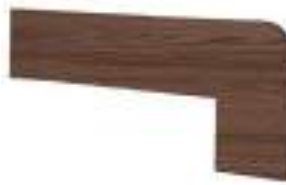
ZANQUÍN RECTO DCHA/IZDA 42,3 x 17,5 cm - 16.7"x 7.0"