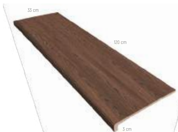
PELDAÑO RECTO 120 33 x 120 x 3 cm - 13.0"x 47.2" x 1.2"