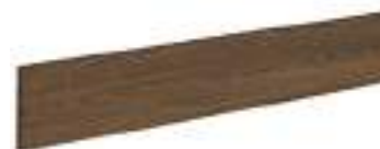
RODAPIÉ 9 x 60 cm - 3.6"x 23.6"