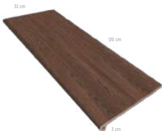
PELDAÑO FIORENTINO 120 33 x 120 x 3 cm - 13.0"x 47.2" x 1.2"

PIEZAS ESPECIALES · SPECIAL PIECES · PIÈCES SPÉCIALES · СПЕЦИАЛЬНЫЕ ЭЛЕМЕНТЫ