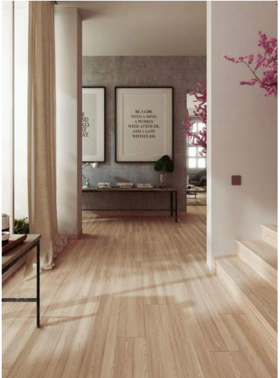
KIOTO NOGAL 20x120 CM [C-1] - TABICA 14,5x120 CM [C-1] - PELDAÑO RECTO 33x120x3 CM [C-1] - RODAPIÉ 9x60 CM