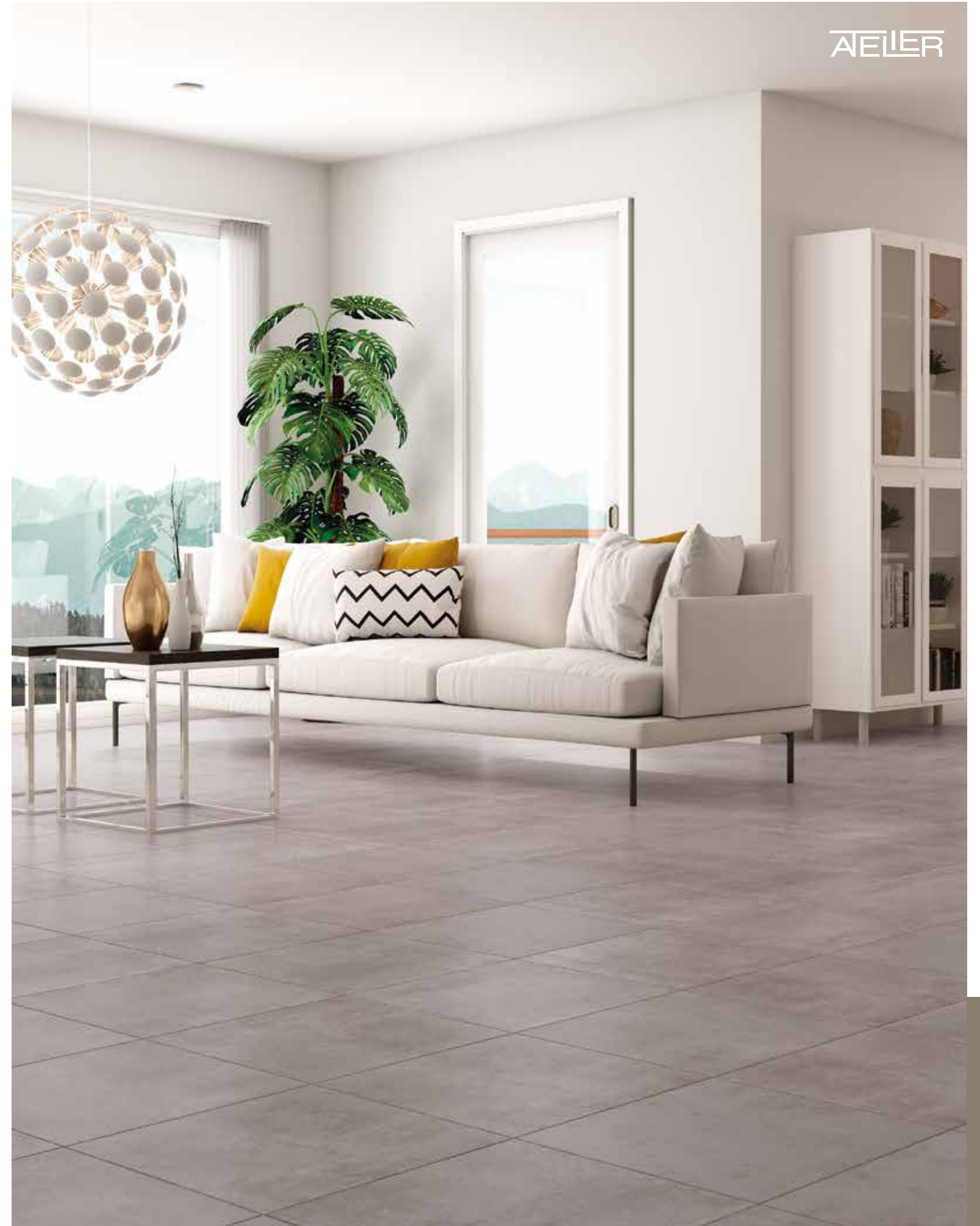
Floor tile Evian Gray 45x45.