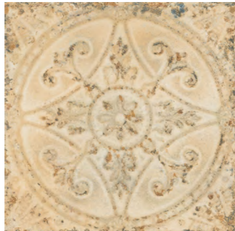
M. FS SAJA